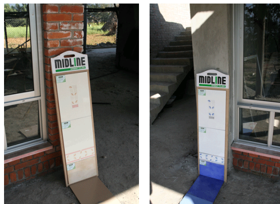
Voorbeeld van tegels die worden toegepast.

In de verdere toekomst zal een nieuw gebouw in dezelfde vorm worden gebouwd tegen het huidige gebouw aan (het perceel grond biedt hier ruimte genoeg voor). De ruimtes zullen dienst gaan doen als workshops om de kinderen hier vaardigheden te leren om in hun onderhoud te kunnen voorzien, en daarbij de mogelijkheid te bieden hier ook daadwerkelijk een toekomst op te bouwen.