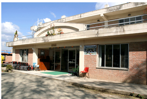
Het Holland House Building

Het Cerebral Palsy Centrum is 22 jaar geleden opgericht en biedt hulp aan kinderen met cerebrale parese als ook aan hun ouders, zonder enige vorm van subsidie van de regering. Sinds maart 2006 staat er door de inspanningen van de stichting Holland Building Nepal een schitterend gebouw op de heuvels in Godawari om kinderen allerlei soorten therapie te geven. Momenteel wordt het gebouw tijdelijk ook gebruikt als schoolgebouw waar een groep van ca. 36 kinderen speciaal aangepast onderwijs en therapie krijgt en diverse vaardigheden leert.