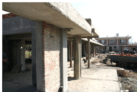
schoolgebouw met rechts op de achtergrond het Holland House Building wat nu naast therapieruimte ook dienst doet als school.

De kosten van de bouw van deze nieuwe school zijn geheel bijeengebracht door de inspanningen van in het bijzonder de stichting Holland Building Nepal, alleen voor de financiering van het sanitair en de watertank voor de watervoorziening voor het gebouw heeft men de hulp van Stichting Maha Mata Nederland ingeroepen.