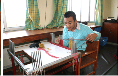
Heel geconcentreerd wordt hier geborduurd, kralen geregen of onderzetters geweven.

Naast aangepast onderwijs, leert men de kinderen ook allerlei vaardigheden om later in hun onderhoud te kunnen voorzien in de workshops die men in de toekomst gaat bouwen op dit perceel grond.