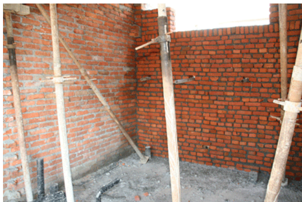
Ruwbouw sanitaire ruimte.

men de mogelijkheid heeft ook iemand zittend of liggend te douchen. Alles wordt betegeld (wanden tot raamhoogte) Tevens worden er aan de beide buitenzijden van de sanitaire units wastafels (totaal 4 stuks) geplaatst zodat de kinderen ook leren hygiënisch te handelen door hun handen te wassen. Boven op de keuken zal de watertank worden geplaatst.. De totale kosten van dit sanitaire project incl. watervoorziening bedraagt € 9231,- ofwel NPR 849265.