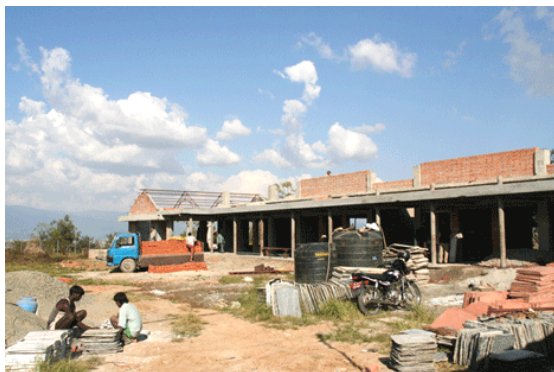
Vooraanzicht schoolgebouw in aanbouw

Enorm onder de indruk van het werk van het SGCP bezoeken we na de lunch de locatie van het in aanbouw zijnde nieuwe schoolgebouw, naast het Holland House Building (therapiecentrum) gelegen.