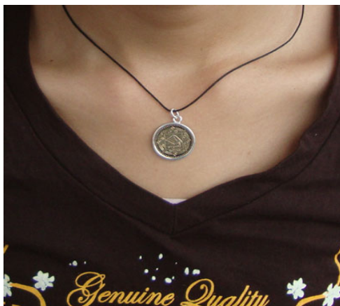
Een rupee munt, gemaakt door Dambar in Nepal.