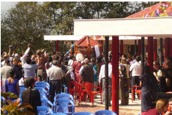
In het midden de molen die door de kinderen werd onthuld.