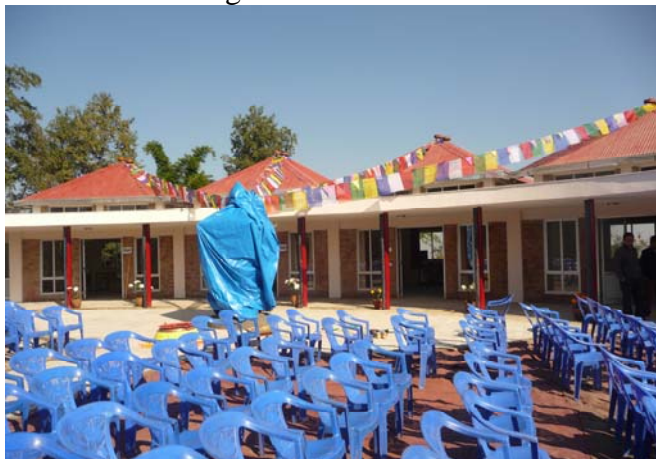
De werkplaats vlak voor het grote openingsfeest. Stilte voor de storm..., met de ingepakte gebedsmolen.

In de maand oktober is voor de 10e keer de reis naar Nepal gemaakt om het project te bezoeken, de kinderen te zien en natuurlijk ook de voortgang van de bouw in ogenschouw te nemen.