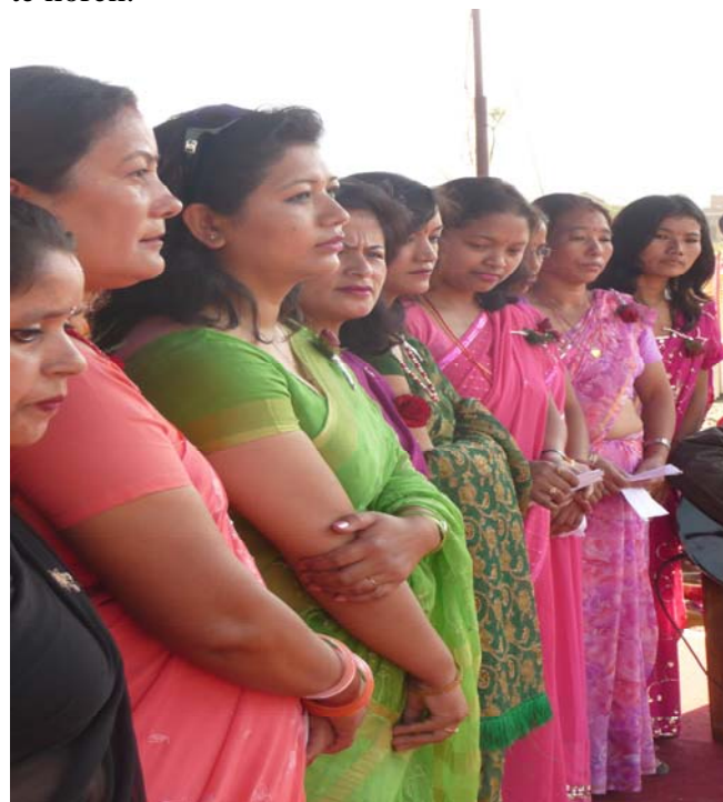
Het dameskoor, de moeders van onze kinderen.

De ouders waren ook zeer trots en blij dat er voor hun kind zulke prachtige voorzieningen zijn getroffen. Ze lieten dat tijdens het openingsfeest ook duidelijk blijken. Ze zongen een prachtig zelf gecomponeerd lied over 'Hamro pio CP Center', ons prachtige CP centrum. Het was ontroerend om te horen.