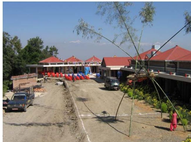
Rechts de school, op de achtergrond de werkplaats. Rechtsvoor de schommel van bamboe.

kunnen voorzien. Een prachtige uitdaging voor ze, een nieuwe dimensie.