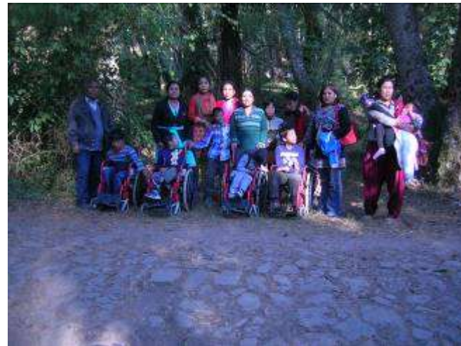
A Genuine Effort